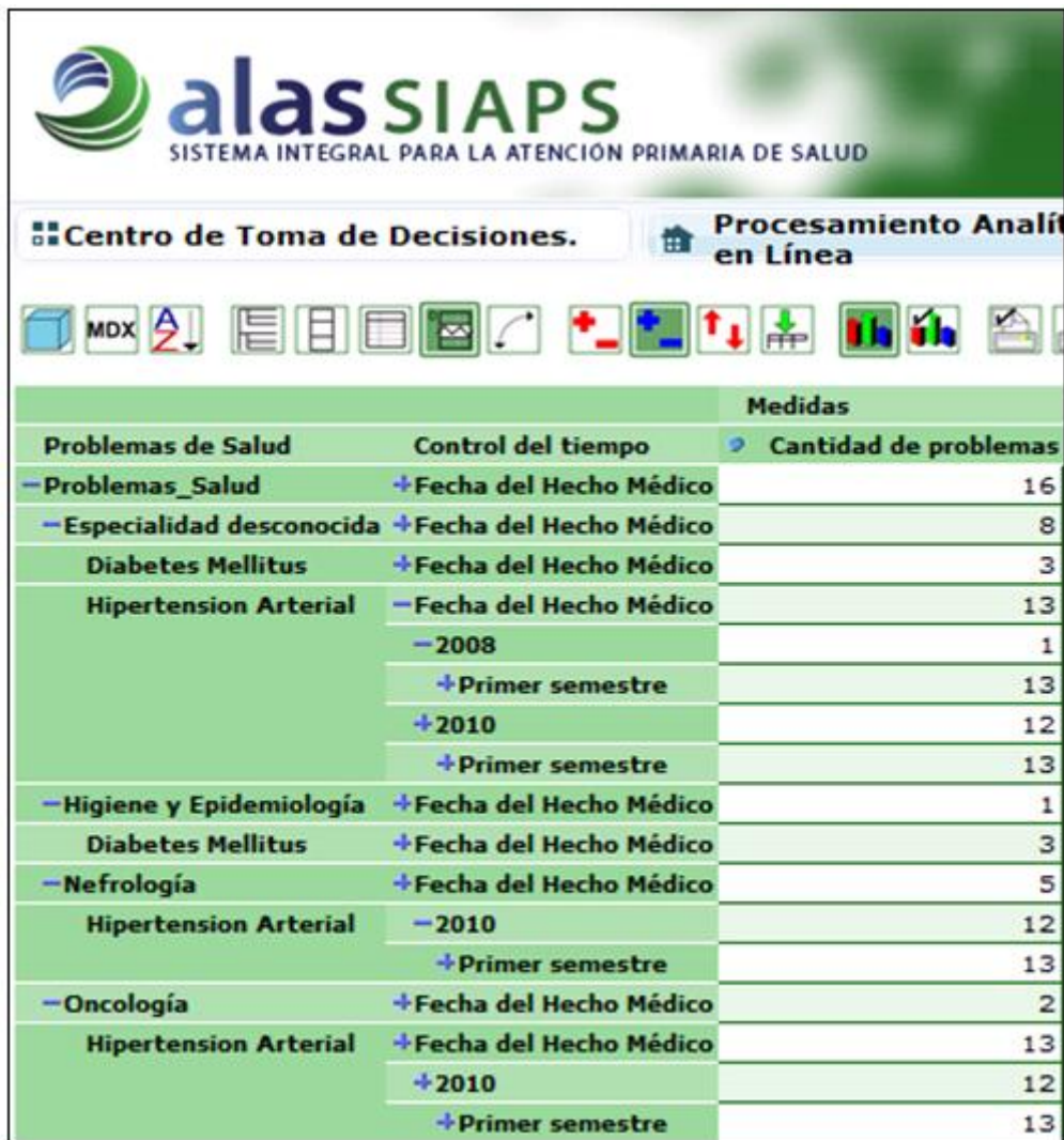
Fig. 5. Comportamiento de la HTA, según el historial de los datos de las HCE

Se precia además como el hábito de fumar, así como el consumo de sal tienen una gran influencia en los pacientes consultados (Fig. 6).