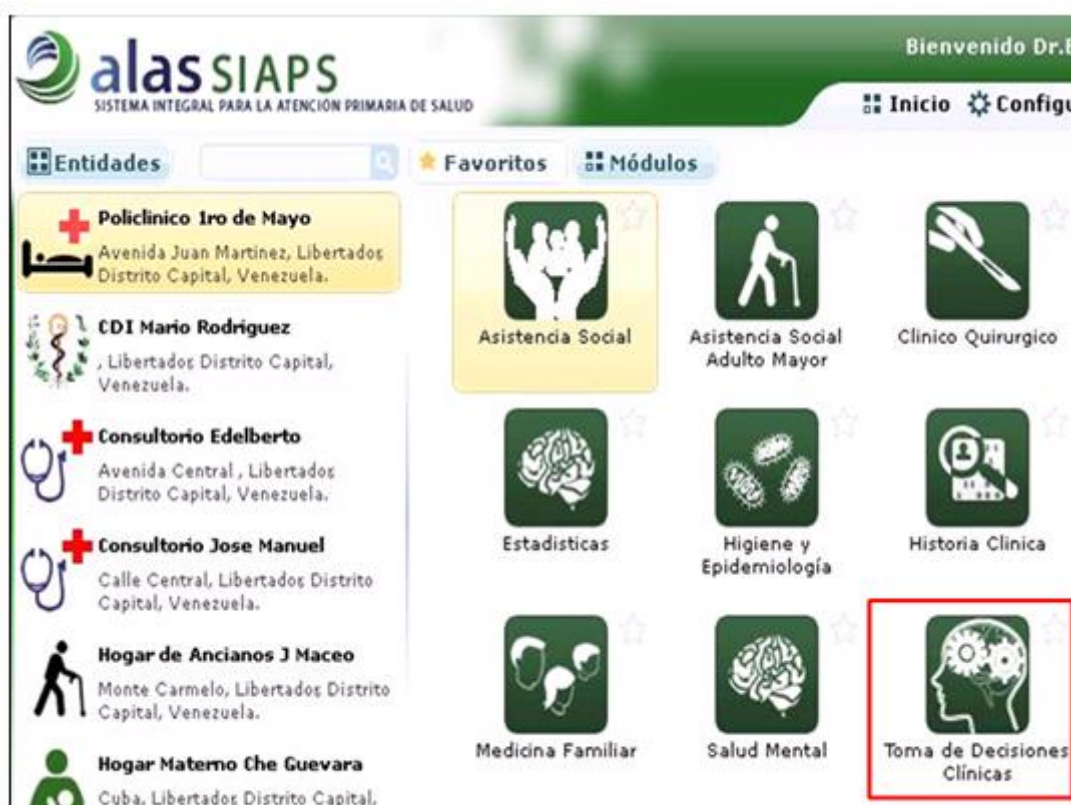
Fig. 2. Herramienta incluida en el sistema alas SIAPS

Como un módulo del Sistema Integral para la Atención Primaria de Salud (alas SIAPS) se construye la herramienta propuesta, aunque también puede ser incorporada al Sistema de Gestión Hospitalaria (alas HIS) como muestra en la figura 2.