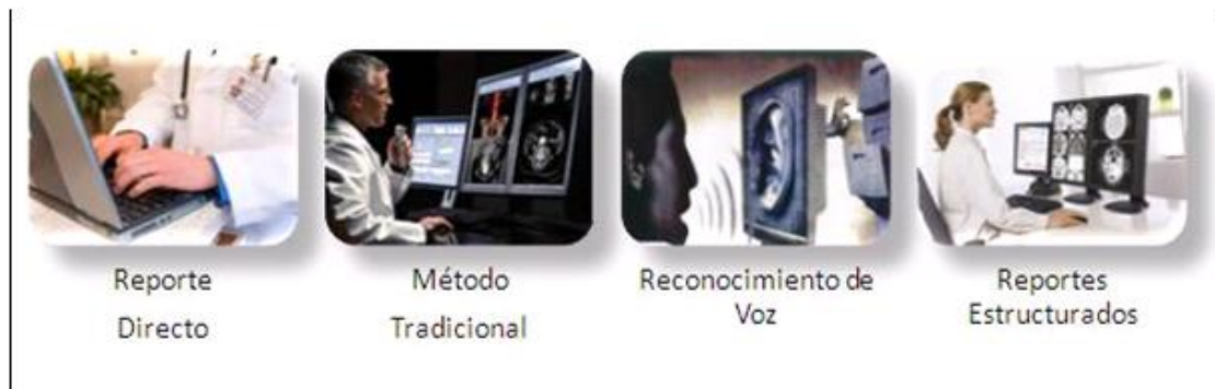
Fig. 1. Metodologías de generación de reportes

Debido a los elementos expuestos anteriormente, es una necesidad el desarrollo de un sistema de reportes imagenológicos que automatice estos procesos permitiendo agilizar, organizar y humanizar este trabajo. Dichos sistemas se pueden clasificar en dependencia de la metodología utilizada para la emisión y almacenamiento del informe (fig. 1).