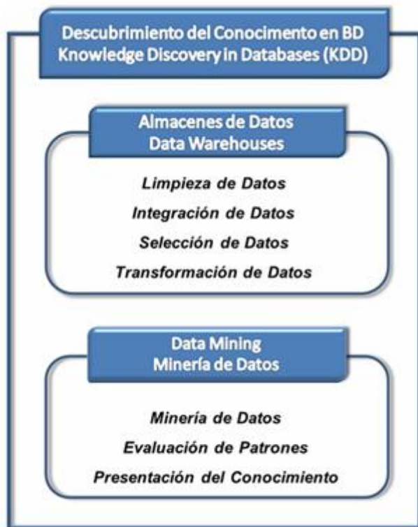
Fig. 1. Procesos que involucra el Descubrimiento de Conocimiento 5

Aunque algunos autores usan los términos Minería de Datos y KDD indistintamente, como sinónimos, existen claras diferencias entre los dos (Fig. 1). Así la mayoría de los autores coinciden en referirse al KDD como un proceso que consta de un conjunto de fases, una de las cuales es la minería de datos. 4 De acuerdo con esto, el proceso de minería de datos consiste únicamente en la aplicación de un algoritmo para extraer patrones de datos y se llamará KDD al proceso completo que incluye pre-procesamiento, minería y post-procesamiento de los datos.