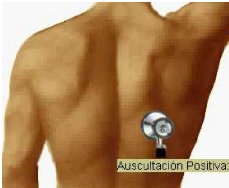
Fig. 1: Imagen con sonido de respuesta a la selección de “auscultación respiratoria” en la pantalla del Examen Físico (selección múltiple).

El sistema de calificación de las opciones utilizado fue el de 5 categorías: positiva indispensable +4; positiva no indispensable +2; neutra 0; negativa perdonable -2; y negativa imperdonable -4